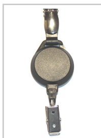
Yoyo med metall- och friktionsclip Artikel nr: KOH-25